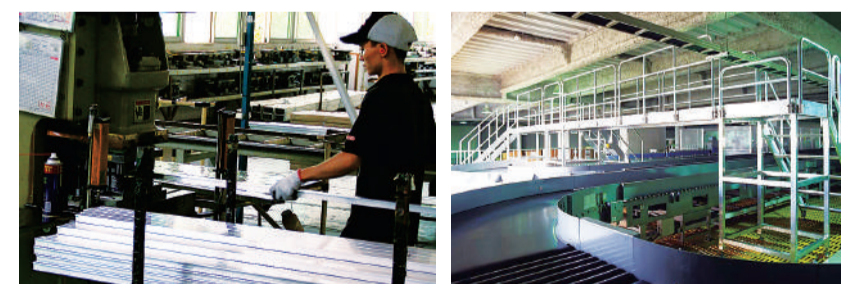
操作扎实，精益求精，质量得以保证。